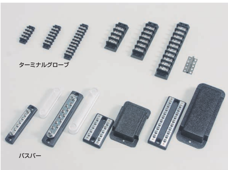
ターミナルグローブ

①②③⑤⑥は⑦のサーキットブレーカーを利用して作られたパネルです。 ④は3個のバッテリーを管理できるボルトメーターで④⑤はそのボルトメーターが組み込まれたサーキットブレーカーパネルです。