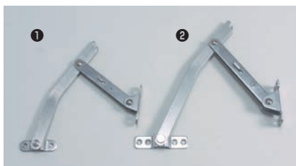
ステンレストッパー付きハッチステー