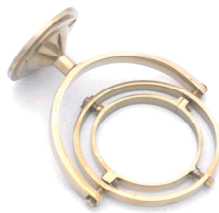
オプション ●ジンバルブラケット ¥12,400 (税抜)