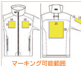
マーキング可能範囲