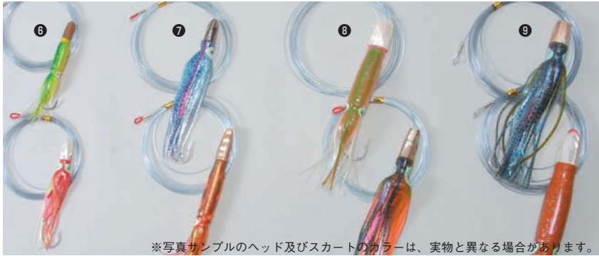
※写真サンプルのヘッド及びスカートカラーは、実物と異なる場合があります。