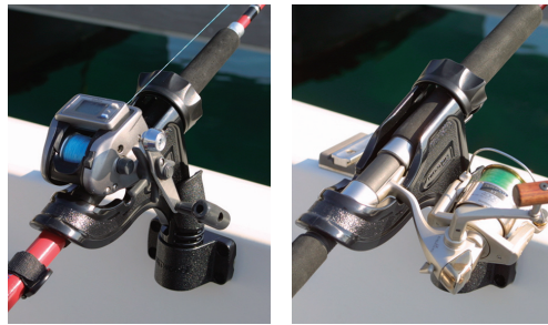
両軸スピニングリール。どちらのリールにも対応できます。