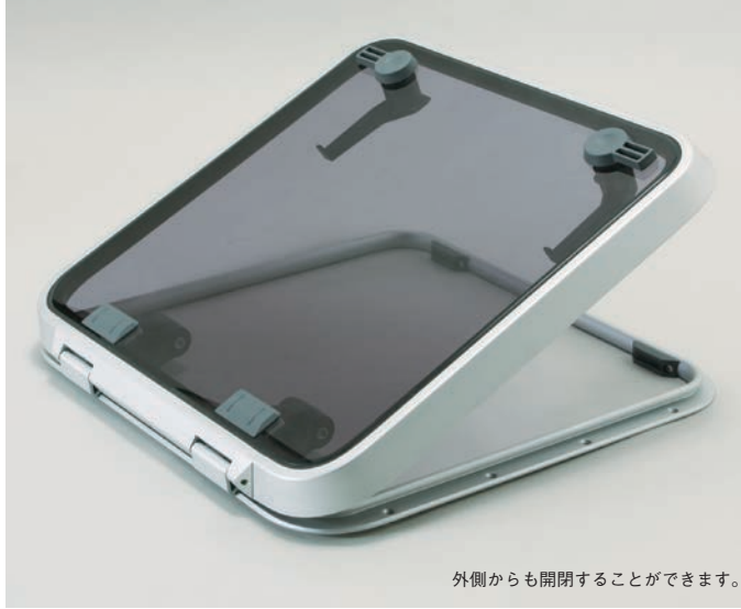
外側からも開閉することができます。