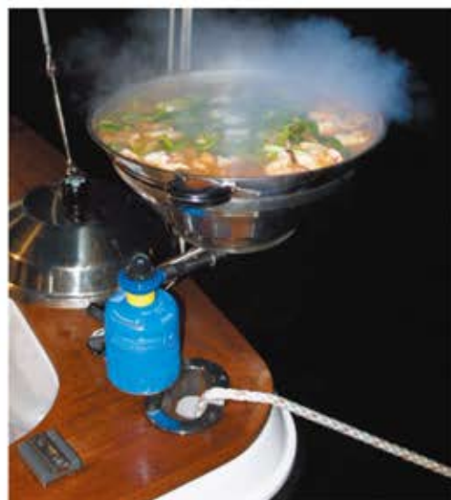
②中華鍋を利用して、釣れた魚で鍋を作りました。この量だと10人分はありました。