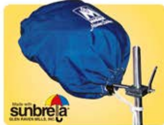
●カバー(収納袋) サンプレラ製 207用 217用