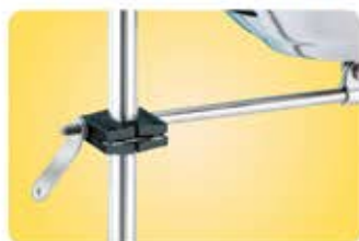
●ラウンドレールマウント 22~25.4mm用 A10-080 28.5~32mm用 A10-085

船に合ったマウント方法を選んで、バーベキューコンロと組み合わせてご使用ください。