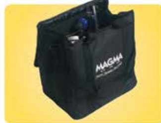
●ストレージケース207/217用