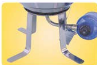
●陸上用スタンド A10-650 全てのマグマコンロに対応します。