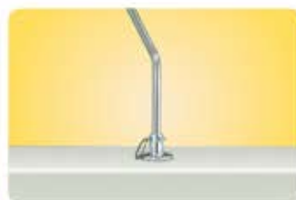
●デッキソケットマウント A10-121 ピンを抜くことで簡単に取り外せます。