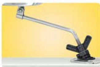
●ロッドホルダーマウント A10-175 ホルダー内径38~47.5mmまでOK