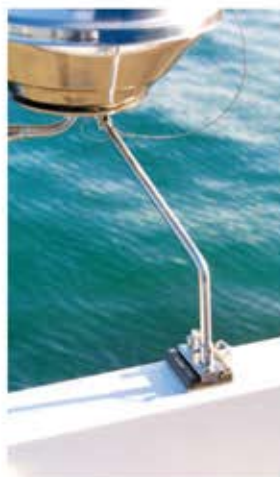
●PL座セットマウント