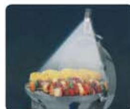
●LEDグリルライト ON-OFFスイッチ付 9Vバッテリー電池付