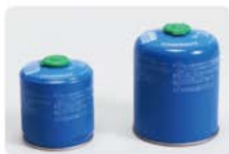
●キャンピングガス ・CV300 ・CV470