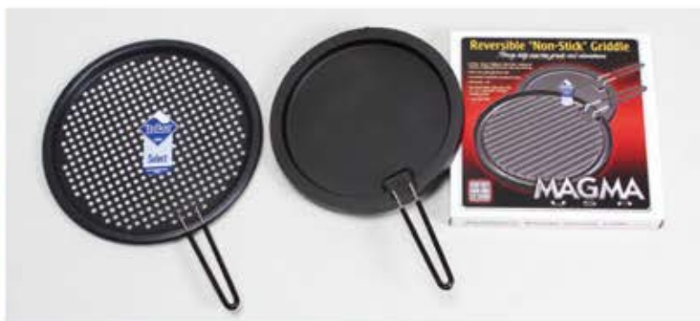
●ステンレス製グリルトレー A10-296 テフロン加工されたグリルトレーです。 サイズ：外径350mm、取り外しハンドル付き ●リバーシブルグリルパン A10-196 テフロン加工されたグリルパンで両面使用が可能です。 サイズ：外径300mm、取り外しハンドル付き