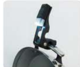
蓋のハンドルにホルドするタイプで、LED 6個で照らします。