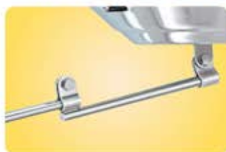
●マウントエクステンション A10-140 マウントを20cm延長できます。