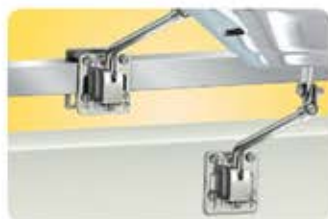
●サイドマウント A10-240 垂直方向面だけでなく角パイプにも対応