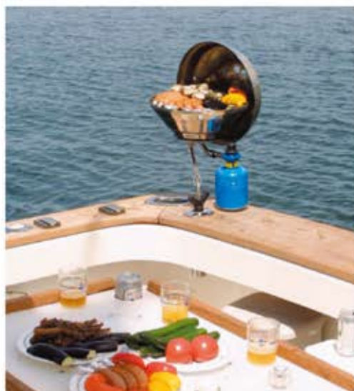
①コンビネーション ガスバーベキューセットとロッドホルダーマウントA10-175で組み合わせました。