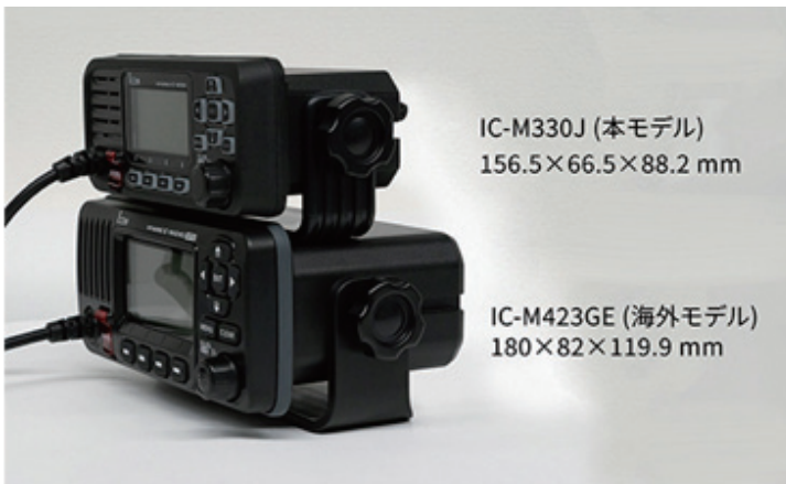
IC-M330J (本モデル) 156.5×66.5×88.2 mm

高機能な国際VHFトランシーバー据置型25Wが超コンパクトボディ (W156.5mm×H66.5mm×D88.2mm) に凝縮、設置場所に迷うことなく (IPX7の防水性能有) 自由度の高い省スペース設置ができます。