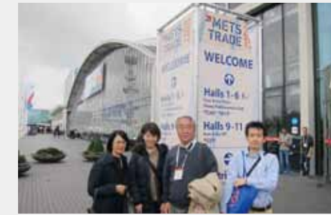
METSトレードショー in AMSTERDAM (MARINE EQUIPMENT TRADE SHOW)