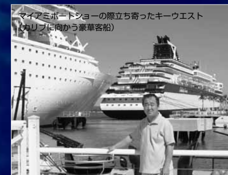
マイアミボートショーの際立ち寄ったキーウエスト (カリブ海に向かう豪華客船)