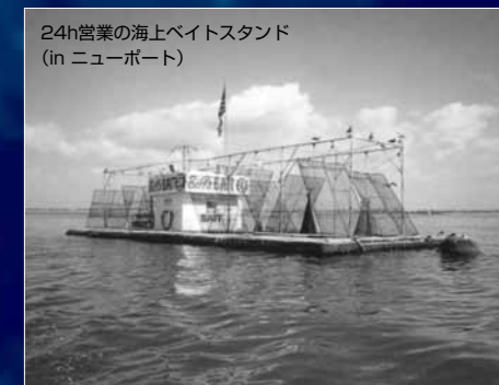
24h営業の海上ベイトスタンド (in ニューポート)

視察をかねて行く海外の展示会では いつも新しい発見と出会いがある。 そこで受けた刺激からアイデアが浮かび 新しい商品を生み出したり、新しい方向性を見出してきた。 そしてそれを形にしてカタログにつめ込んできた。 伝統を重んじながら新しい風を吹き込む... ずっとそんな想いで走ってきた。そして、これからも。