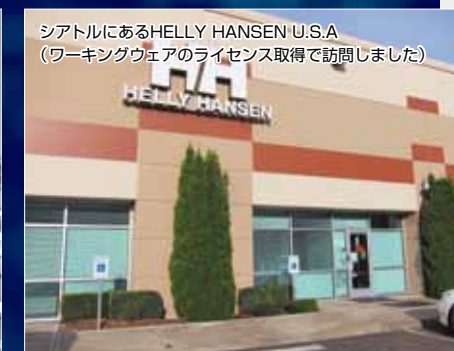
シアトルにあるHELLY HANSEN U.S.A (ワーキングウェアのライセンス取得で訪問しました)