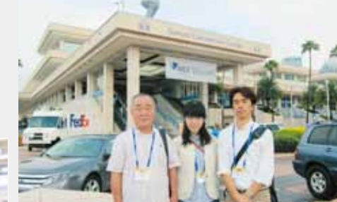
IBEXボートビルダーショー TAMPA CONVENTION CENTER, FLORIDA