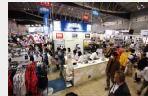
ジャパンインターナショナルボートショー in YOKOHAMA (FMSは毎年出展しています)