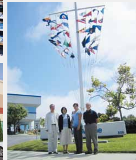
カリフォルニア ワトソンビルにあるWEST MARINE 本社と倉庫を訪問しました