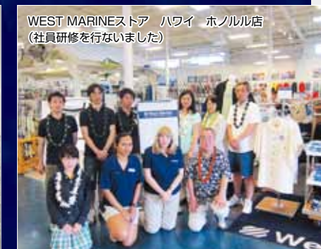
WEST MARINEストア ハワイ ホノルル店 (社員研修を行ないました)